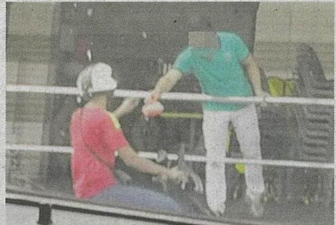
Pelanggan menyerahkan duit kepada pekerja restoran di Bukit Beruntung.

Beberapa minit kemudian, pelanggan terbabit akan kembali untuk mengambil makanan ditempah yang dibungkus dalam plastik.