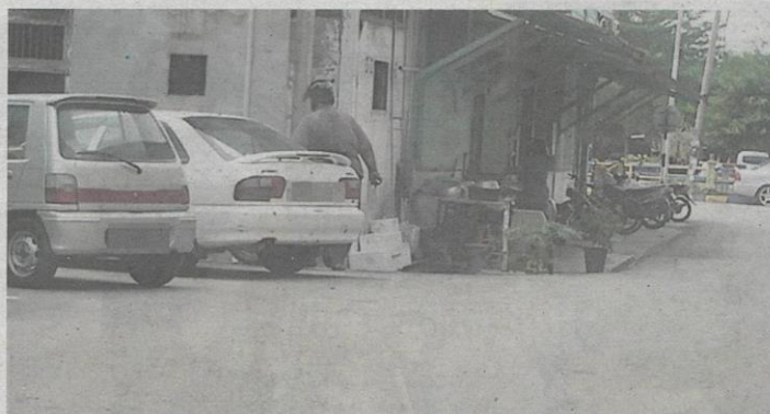
Seorang pelanggan menggunakan laluan pintu belakang sebuah kedai makan di Sabak Bernam.