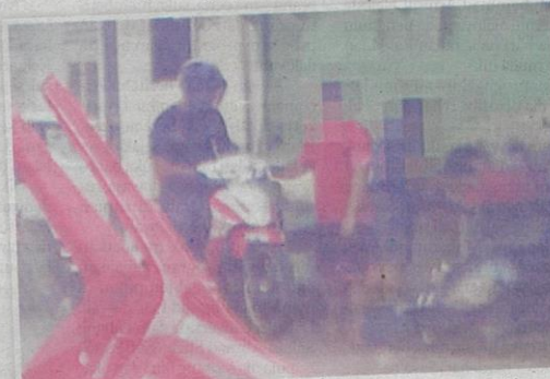
Kelihatan pekerja kedai makan menghulurkan bungkusan makanan kepada kaki ponteng puasa yang membeli makanan melalui pesanan pandu lalu.

Menurut Md Firdaus, sekiranya seseorang individu tidak berpuasa sekali pun atas sebab ter-