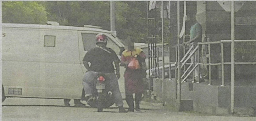
Pekerja restoran menunggu pelanggan di hadapan sebuah premis di Bukit Beruntung.

"Sebulan saja puasa bukannya lama, itu pun nak ponteng. Su-