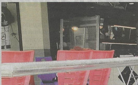
Kaki ponteng puasa dikesan membeli makanan di sebuah kedai makan di U12 pada kira-kira jam 1 petang.

"Kedai makan tu pula sebelah pasar raya. Orang bawa anak pergi pasar raya nampak pula kaki tak puasa ini membeli makanan," katanya.