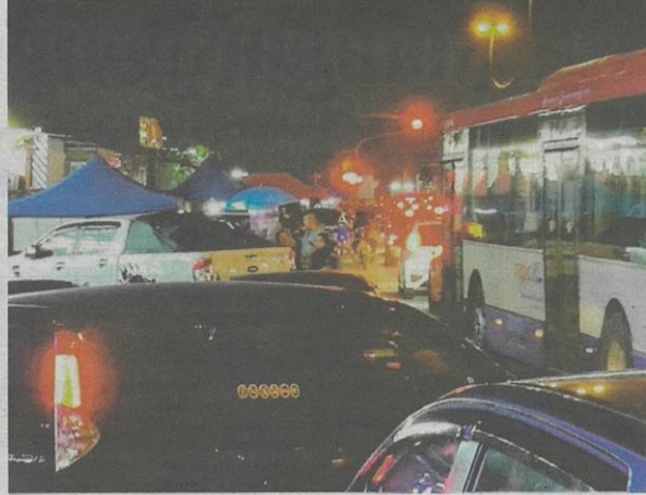
Keadaan sesak pada waktu puncak 9 hingga 11 malam.