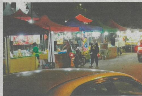
Deretan gerai tepi jalan di Jalan Teknologi berhampiran Uptown Kota Damansara.