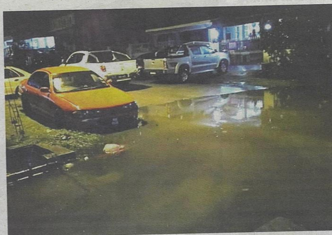
Keadaan banjir di Taman Semenyih Indah selepas hujan lebat awal pagi semalam.