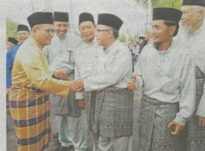
Menteri Besar Selangor, Amirudin Shari (kiri) bersalaman dengan jawatankuasa masjid.