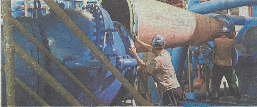
Ongoing repair works at the SSP3 Water Treatment Plant yesterday.