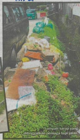
Sampah sarap yang ditinggalkan peniaga tepi jalan.

Sinar Harian akan mendapatkan maklum balas dari Majlis Bandaraya Petaling Jaya (MBPJ) berhubung isu berkenaan dalam waktu terdekat.