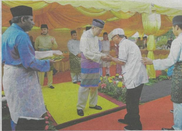
Sultan Selangor, Sultan Sharafuddin Idris Shah (tengah) berkenan menyempurnakan agihan sumbangan 468 asnaf fakir miskin dan muafal di Masjid An Naim Kampung Sungai Sembilang.

Beliau berkata demikian sempena Majlis Ihya