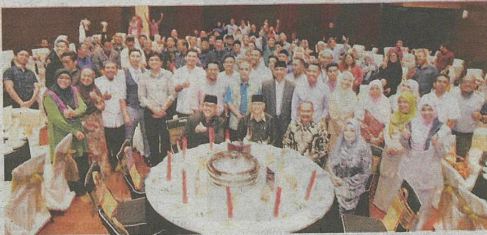
Sebahagian media dan agensi kerajaan yang hadir sempena Majlis Berbuka Puasa Bersama Media di Plenary Hall SACC Shah Alam kelmarin.